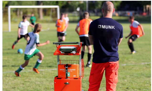
Sicherheit auf Sportveranstaltungen