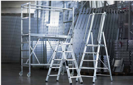
MUNK Günzburger Steigtechnik