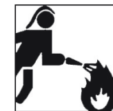
EN 15614:2007 A1 +A2

Die Buchstaben unten dem Piktogramm geben Ihnen Informationen über das Verfahren nach dem die Flammenausbreitung gemäß EN ISO 15025 geprüft wurde: